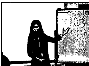
児童とベンガル語名刺作りワークショップ