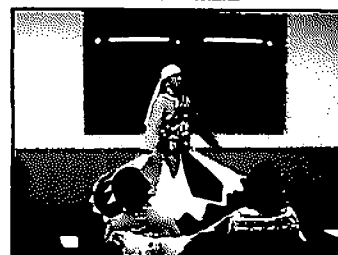
エジプト紹介とタンヌーラ披露