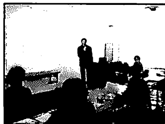
熱帯林をテーマとした講演